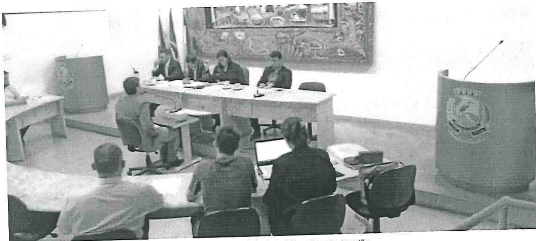
A CPI dos áudios da Câmara de Guarapari realizou na manhã de hoje (6) mais uma reunião