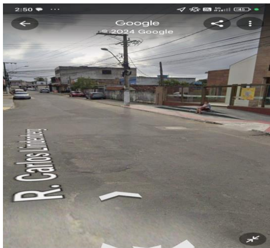
R. Carlos Lindenberg - Independência Guarapari - ES · 2,3 km