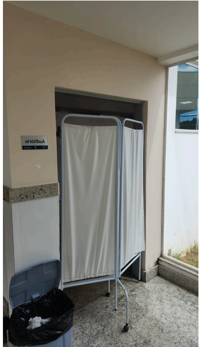
Ausência de portas nos consultórios e salas