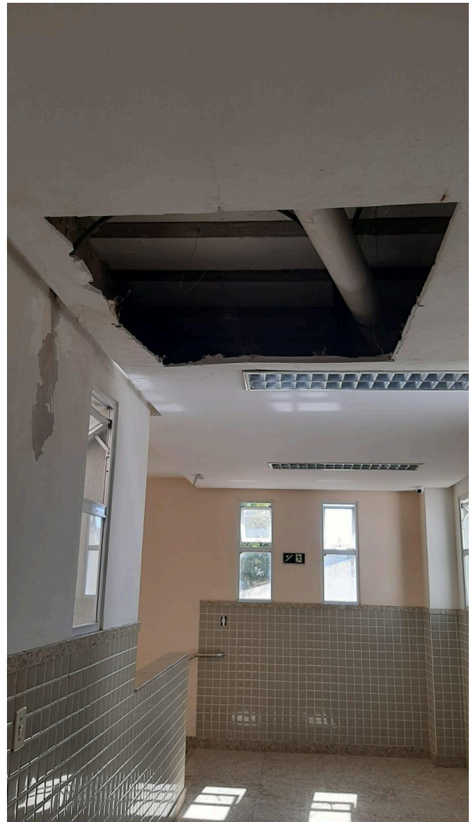
Anexo - Câmara Municipal de Guarapari, Gabinete n.º 05