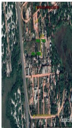
Legenda em anexo, a cargo da Câmara Municipal de Guarapari, encaminhada pelo ver. 1º Vice-Líder

AVENIDA DO LOTEAMENTO DO RESERVA GERALDO JOSÉ DE OLIVEIRA