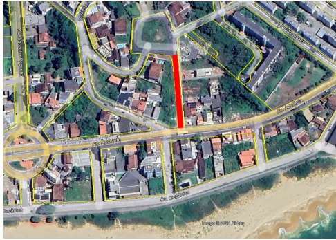
RUA JANETE (IMAGEM).png ~1.6 MB