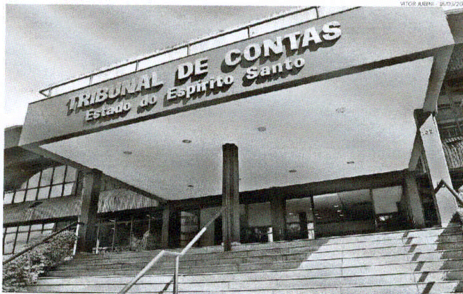
Tribunal de Contas fiscaliza, entre outros, as prefeituras do Estado e deve receber informações oficiais

As consequências existem, mas atrasos como o registrado no início deste ano são absolutamente